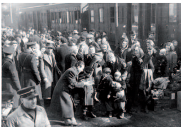
Nella foto: Esodo giuliano-dalmata a Torino, da Storia di un esodo. Istria 1945-1956 Ed. Istituto regionale per la storia del movimento di liberazione in Friuli Venezia-Giulia, Trieste 1980

Il Parlamento italiano riconosce il 10 febbraio quale "Giorno del Ricordo" in memoria delle vittime delle foibe, dell'esodo giuliano-dalmata, delle vicende del confine orientale.