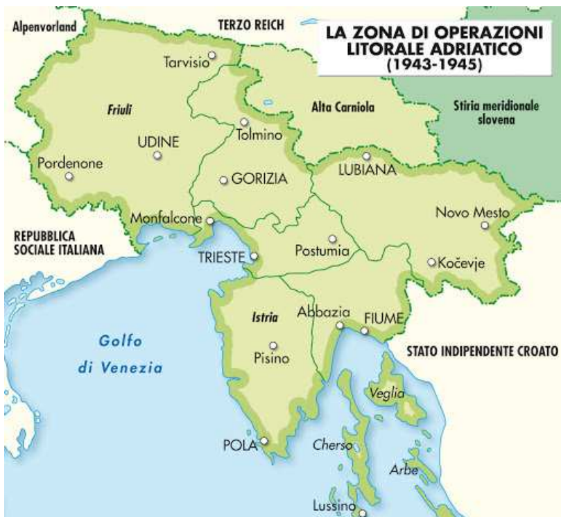
Il Litorale Adriatico (OZAK) creato nel settembre 1943.

La politica di occupazione nazista nel Litorale Adriatico intende perseguire diversi obiettivi insieme: a) la cattura e la deportazione ad Auschwitz degli ebrei, per proseguire la Shoah, cioè il piano sistematico di genocidio già avviato in maniera coordinata dall'estate-autunno 1941 durante la guerra di aggressione all'URSS; b) il controllo del territorio reprimendo ogni forma di opposizione e resistenza; c) rastrellamento massiccio di civili per il lavoro coatto nelle industrie belliche del Reich; d) esecuzioni sommarie di partigiani, sospettati o denunciati di resistenza; e) saccheggio delle risorse economiche e violenze di massa sui civili (es. incendi di case e villaggi, uccisioni, deportazioni).